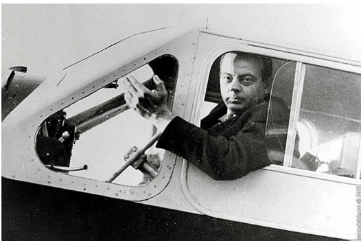
อ็องตวน เดอ แซ็งแตกซูว์เปรี (Antoine de Saint-Exupéry)

รายงานฉบับนี้จัดทำขึ้นโดยข้อมูลเท่าที่ปรากฏและเชื่อว่าเป็นที่น่าเชื่อถือได้แต่ไม่ถือเป็นภาระยืนยันความถูกต้องและความสมบูรณ์ของข้อมูลนี้ โดยบริษัทหลักทรัพย์ ยูเอสบี เคย์ เฮียน (ประเทศไทย) จำกัด (มหาชน) ผู้จัดทำขอสงวนสิทธิ์ในการเปลี่ยนแปลงความเห็นหรือประมาณการณั้ต่าง ๆ ที่ปรากฏในรายงานฉบับนี้ โดยไม่ต้องแจ้งล่วงหน้า รายงานฉบับนี้มีวัตถุประสงค์เพื่อใช้ประกอบการตัดสินใจของนักลงทุน โดยไม่ได้เป็นการชี้นำชักชวนให้นักลงทุนทำการซื้อหรือขายหลักทรัพย์ หรือตราสารทางการเงินใดๆ ที่ปรากฏในรายงาน